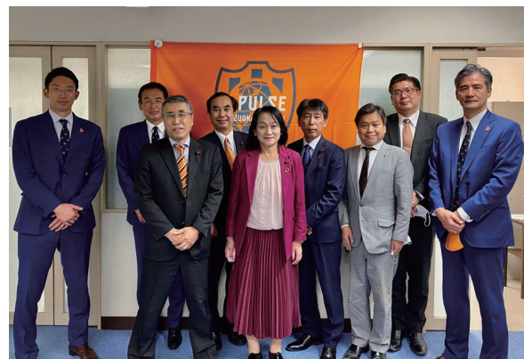
静岡市議会も清水エスパルスを応援しています！