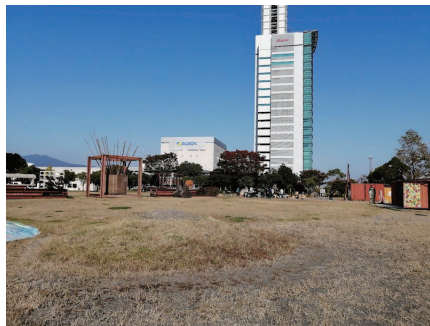
現在の JR 東静岡駅北口市有地

平成 20 年度に東静岡地区への多目的アリーナ施設建設の要望があり、令和元年度に東静岡駅北口市有地を有力候補地とし、令和 2 年度には、振動・騒音調査、交通調査・対策案の検討、市場調査、経済波及効果などの調査を進めました。