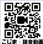
こじま・議会動画

静岡市議会では、本会議の様子を生中継と録画中継でご覧いただけます。 右のQRコードから、私の全質問項目が確認でき、本会議の動画もご覧いただけます。 是非、ご覧ください。