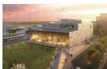
海洋・地球総合ミュージアムイメージ

Q 施設内容の周知と開館までの盛り上げのために、どのような活動を計画していますか。