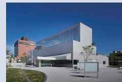
2021年リニューアルオープンした「八戸市美術館」

八戸市美術館では、天井が約17mもある巨大な空間「ジャイアントルーム」が1階にあり、この部屋を市民が自由に出入りできます。また熊本市現代美術館は市街地のビルの中にありますが、美術館を出て商店街のアーケード内での出前展示や、トークショー・上映会などのイベントを実施しており、美術館が身近に感じるイベントを多く実施していると感じました。