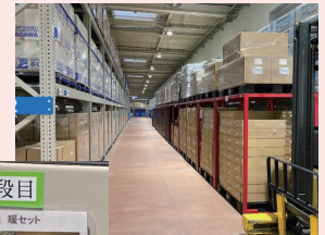
東松島市 防災備蓄基地

東松島市の防災備蓄計画では、東日本大震災の教訓で、発災から3日程度は国や県からの支援が届かなかったことから、市内で3日分は食料や飲料水などの備蓄が必要としています。防災備蓄倉庫は避難所となる小中学校などの敷地内に全体の半分、避難者が多い避難所へ物資を補充する防災備蓄基地に残り半分を備蓄しています。備蓄品の中身を棚ごとに写真で掲載していたり、津波で全身が濡れた避難者に対し、衣類を男性・女性・サイズ別に、上着・下着・ズボンなど一式まとめて保管してる様子を興味深く視察しました。