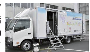
トイレトラックの例 (藤枝市)

A 機動性があり、必要な時にすぐに利用でき、また、広く衛生的で、お年寄りや子ども、女性でも安心して利用できるという優れた特性を持つトイレトラックを、災害時だけでなく、平常時は本市の屋外イベントなど様々な場で積極的に活用していきます。また、運用ルールの検討を進め、学校や自治会での地域活動、各団体が実施するイベントなどにおいても円滑に活用していただくことを目指します。今後は、トイレトラックの効果や実用性を確認しつつ、導入台数の増加に向けて検討を進めていきます。