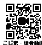
こじま・議会動画

静岡市議会では、本会議の様子を生中継と録画中継でご覧いただけます。右のQRコードから、私の全質問項目が確認でき、本会議の動画もご覧いただけます。是非、ご覧ください。