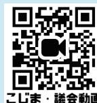
こじま・議会動画

右の QR コードから、私の全質問項目が確認でき、本会議の動画もご覧いただけます。 是非、ご覧ください。