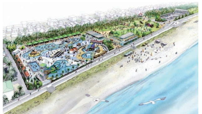
大浜公園プールリニューアルイメージ

プールの利用料金は、高校生以上 800 円、小中学生 400 円が想定されています。来年 7 月リニューアルオープン予定です。