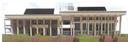
【新しくなる静岡文化会館イメージ】