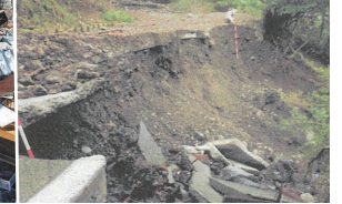
崩落した林道 (葵区口坂本)