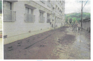
泥に覆われた団地 (清水区石川新町)