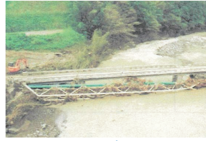
被災した水管橋 (清水区和田島)