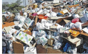
山積みされた災害ごみ