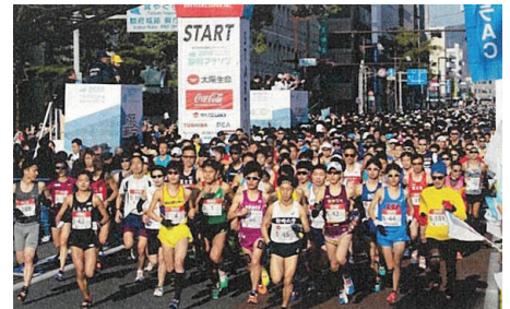
静岡マラソン 2019の様子

新型コロナウイルスの影響により中止が続いていた静岡マラソンですが、負担金を従来より倍増し、市主導で再開することとなりました。出場者の約8割が市外・県外からの参加で、前回大会では15億6,000万円の経済効果があったとされています。